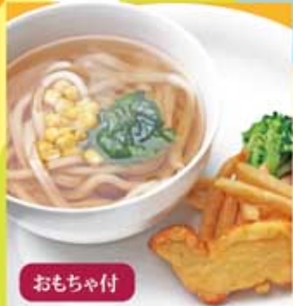
お子様うどん おもちゃ付 366Kcal 1.7g 380円(税込)