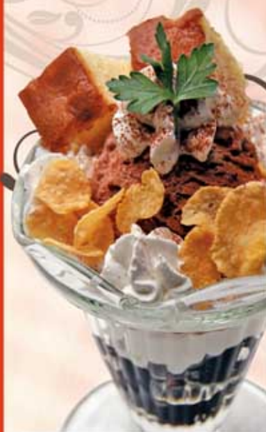
モカパフェ 500円(税込)