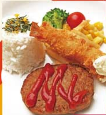
お子様ハンバーグ おもちゃ付 498Kcal 1.5g 550円(税込)