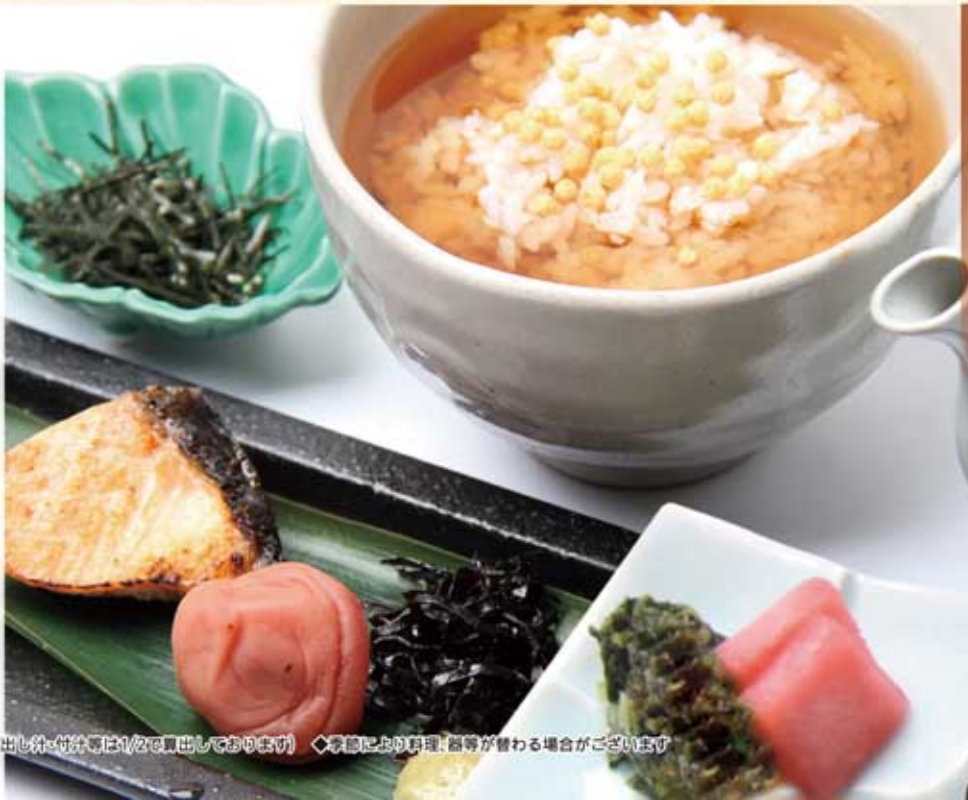
お茶漬けセット 550円(税込)