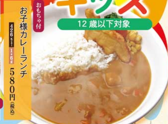
お子様カレーランチ 426Kcal 1.6g 580円(税込)