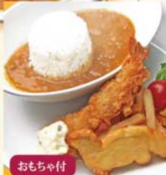
お子様カレーランチセット おもちゃ付 500Kcal 1.7g 680円(税込)