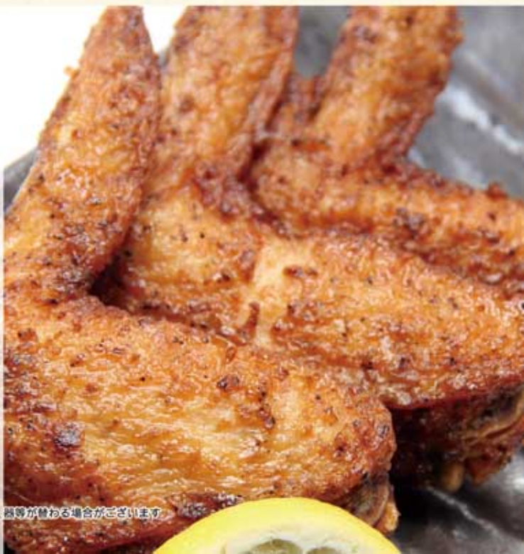
黄金手羽先唐揚げ