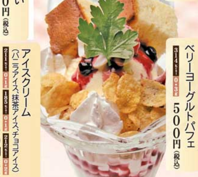
ベリーヨーグルトパフェ 314Kcal 0.3g 500円(税込)