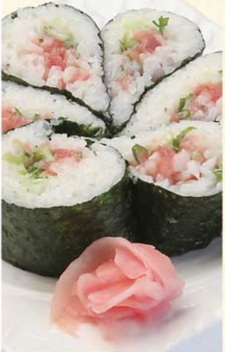
ネギトロ一本巻き