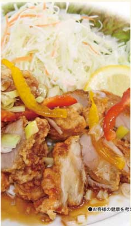
鶏の唐揚げ油淋ソースかけ