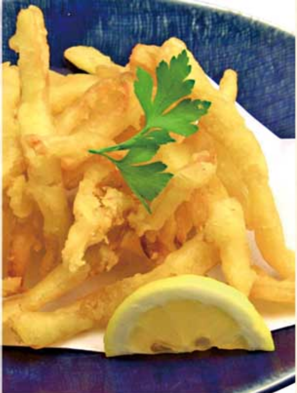
さきいかの天麩羅