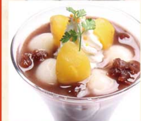
冷し白玉栗ぜんざい 849Kcal 4.6g 500円(税込)