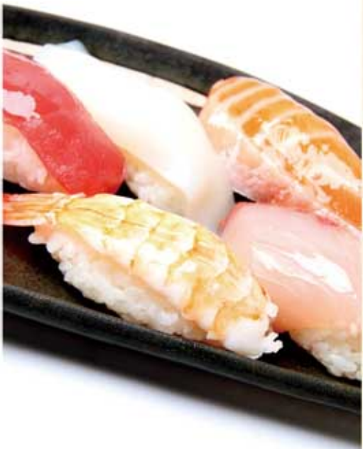
竹(上にぎり寿司五種)