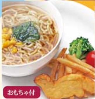
お子様ラーメン おもちゃ付 417Kcal 1.4g 380円(税込)