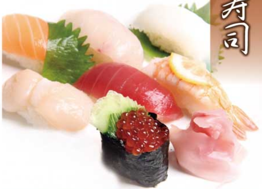
松(上にぎり寿司七種)