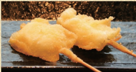
烏賊 1本 155円(税込170円)