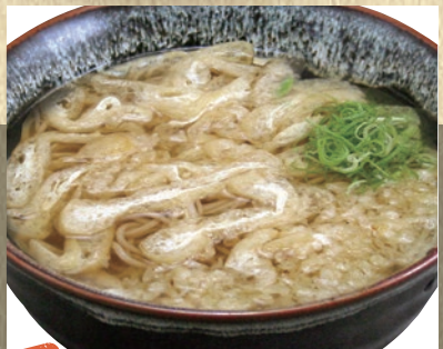
温ミニ蕎麦 382円(税込420円)