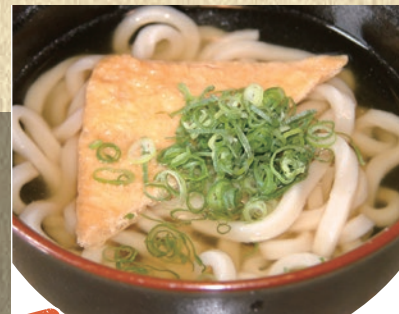
温ミニうどん 382円(税込420円)