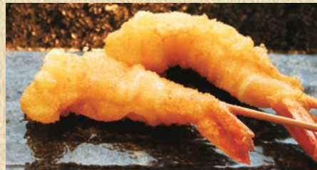
海老 1本 200円(税込220円)