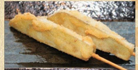
なす 1本 119円(税込130円)