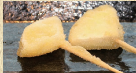
カマンベール 1本 173円(税込190円)