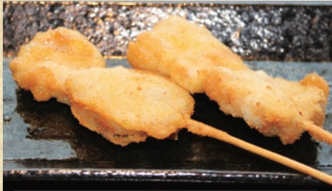
茶美豚ロース 1本 219円(税込240円)