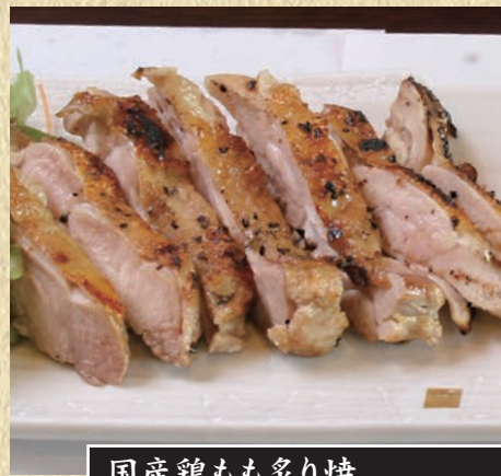
国産鶏もも炙り焼 819円(税込900円)