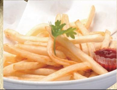
ポテトフライ 373円(税込410円)