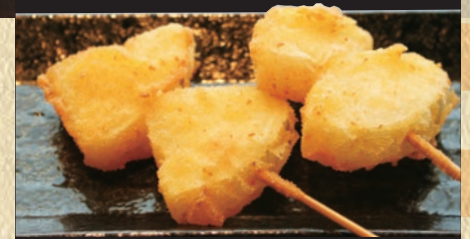
玉ねぎ 1本 119円(税込130円)