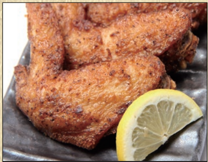
手羽先唐揚げ(2本) 428円(税込470円)