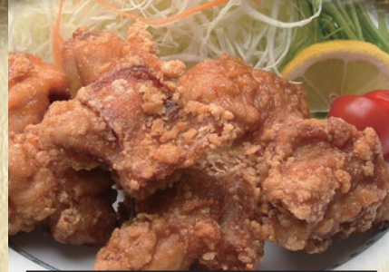
鶏唐揚げ 646円(税込710円)