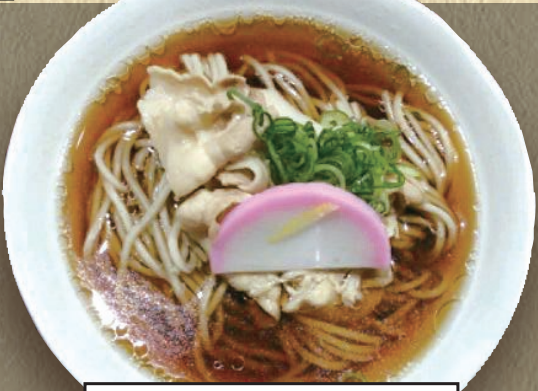
ミニ肉そば 473円(税込520円)