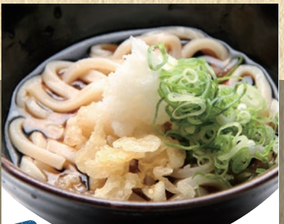
冷ミニうどん 382円(税込420円)