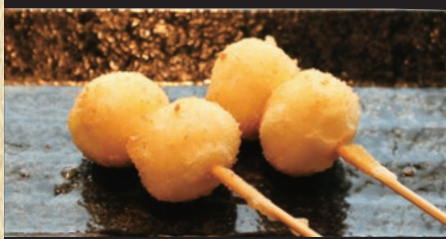
うずら 1本 119円(税込130円)