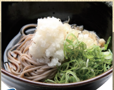
冷ミニ蕎麦 382円(税込420円)