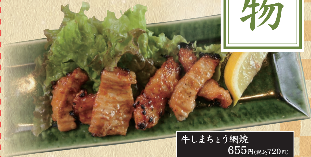
牛しまちよう網焼 655円(税込720円)