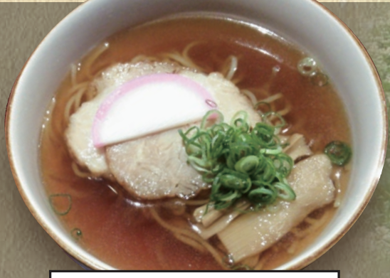
ミニチャーシュー麺 473円(税込520円)