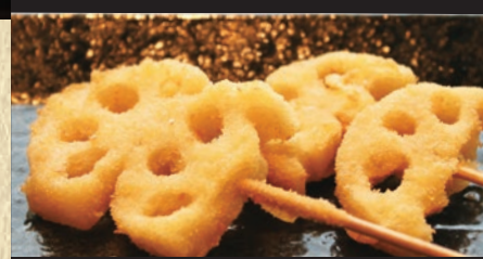
れんこん 1本 119円(税込130円)