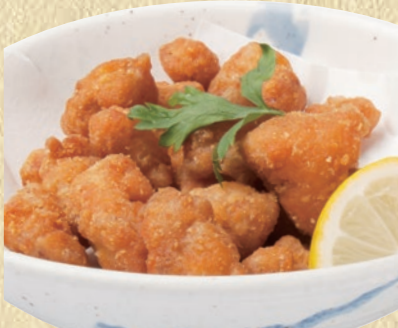
なんこつ唐揚げ 382円(税込420円)