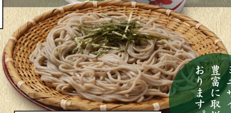
せいろ蕎麦 555円(税込610円) ※せいろ蕎麦は普通サイズです。