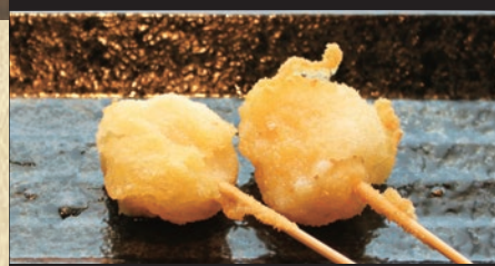
ほたて貝柱 1本 219円(税込240円)