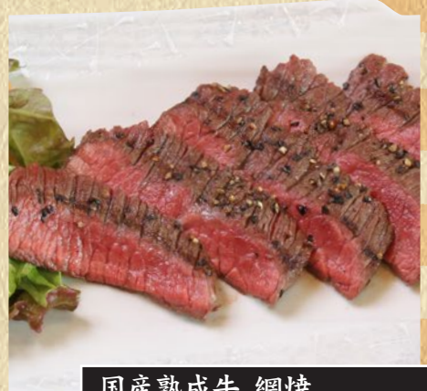
国産熟成牛 網焼 1,228円(税込1,350円)