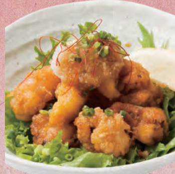
たこの唐揚げポン酢