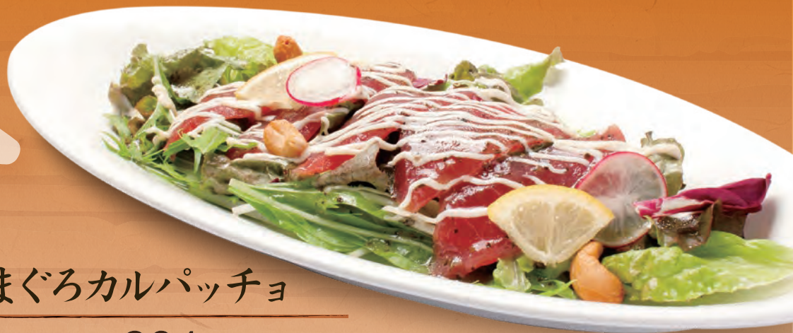
まぐろカルパッチョ