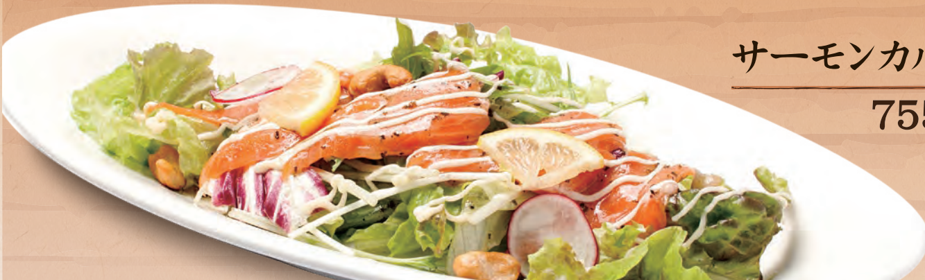
サーモンカルパッチョ