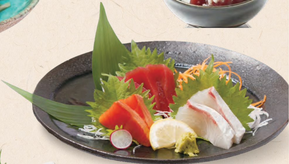
三種盛り 864円 (税込950円)