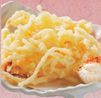
さきいかの天ぷら