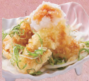
とり天おろしポン酢